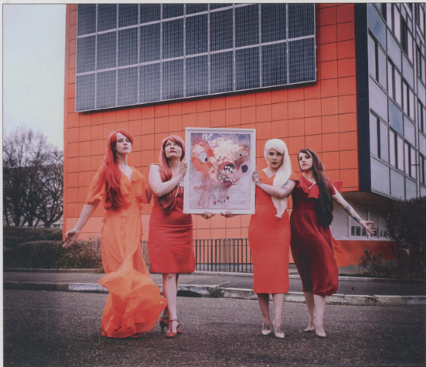
ÉLÉMENT : FEU. ŒUVRE : LE SOLEIL. DIJON, 2017.