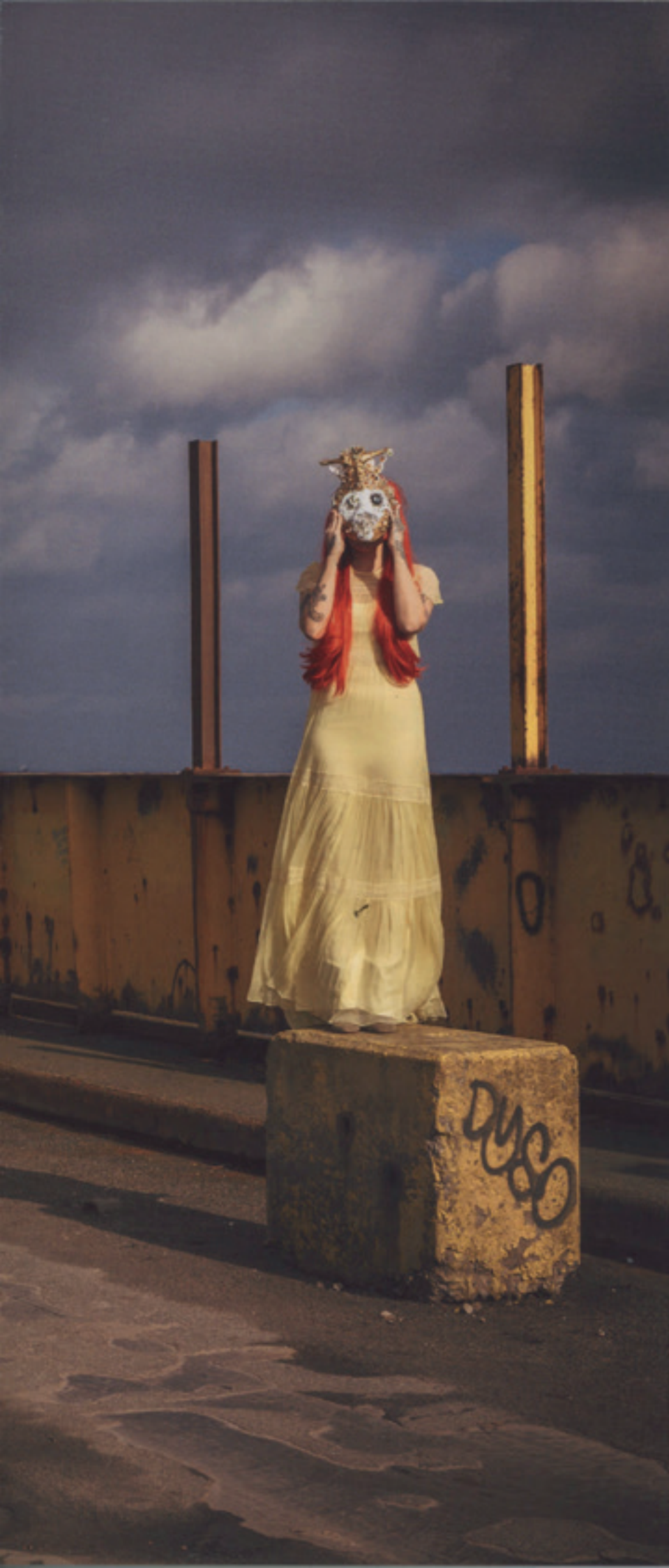
ÉLÉMENT : AIR ŒUVRE : LE CHAMP DES GUERRIÈRES COPENHAGUE, 2017