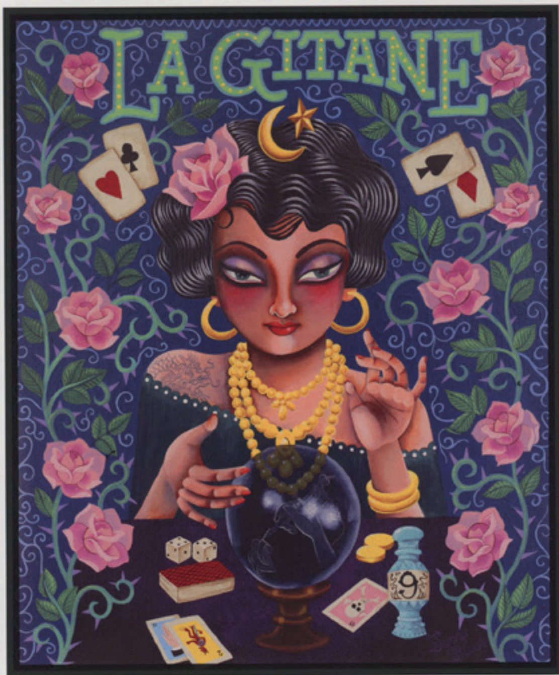
La Gitane, acrylique 53 x 64 cm À droite: The Unappreciated Gift, acrylique 60 x 70 cm