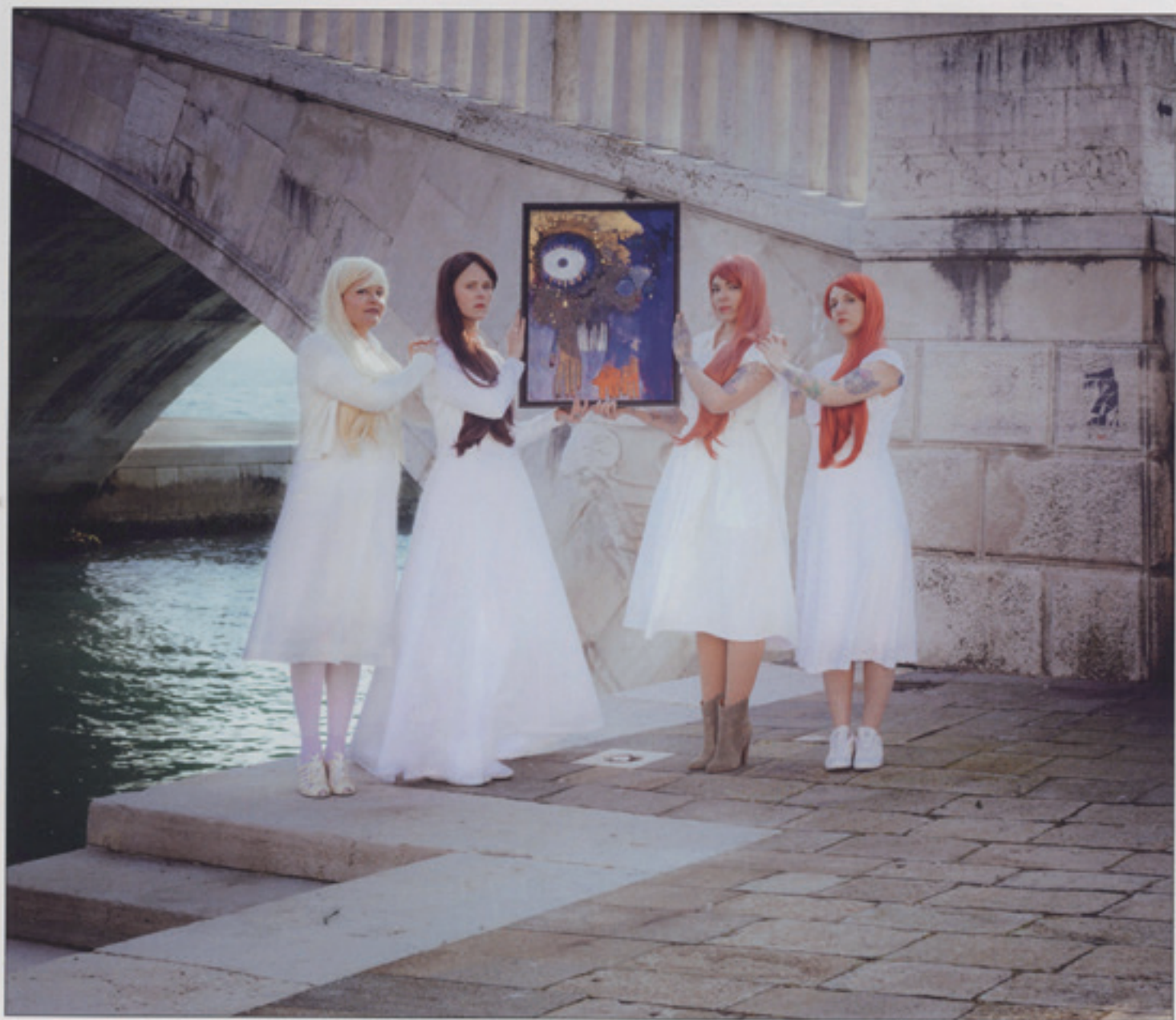
ÉLÉMENT : EAU. ŒUVRE : LE CHAMP DES LARMES. VENISE, 2017.