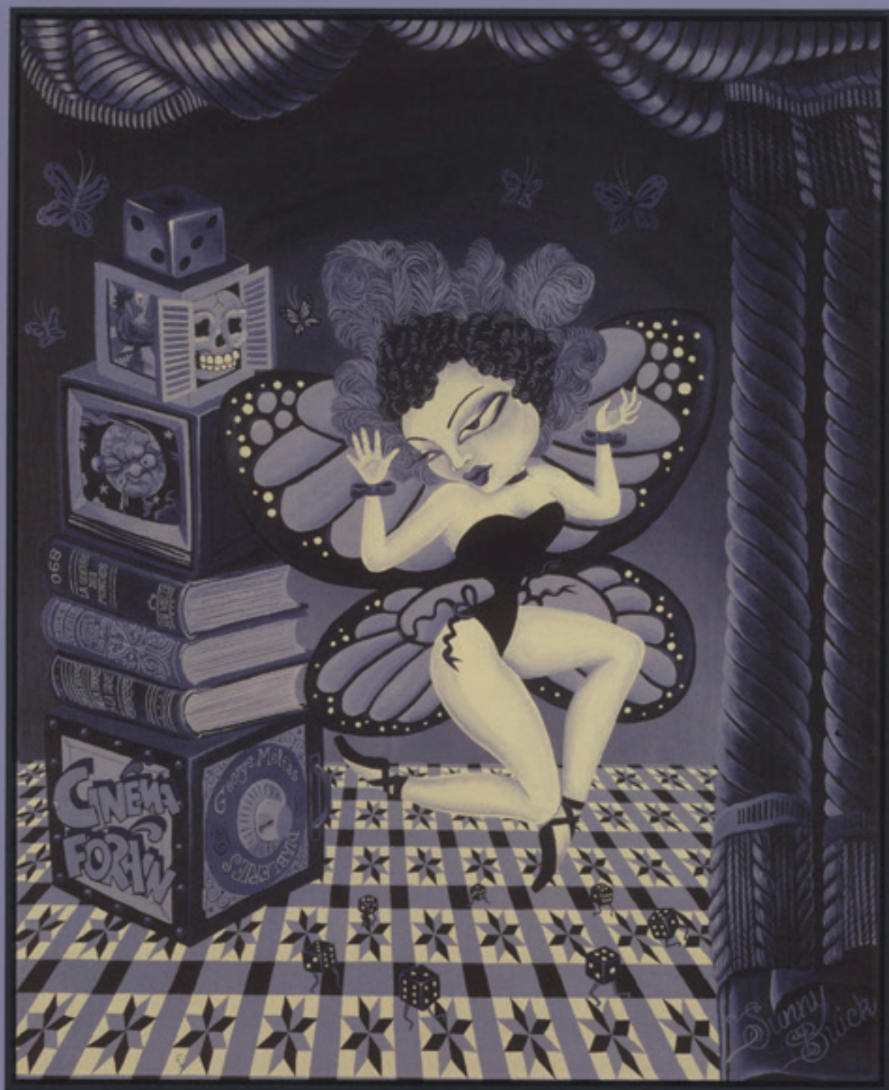
Cinéma Forain, acrylique 60 x 72,5 cm